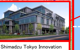
Shimadzu Tokyo Innovation Plaza(仮称)【(株)島津製作所】 延床面積:約9,549㎡ 2021(R3)年4月開所予定