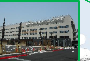
川崎キングスカイフロント東急REIホテル(客室数:186室) 2018(H30)年6月運営開始