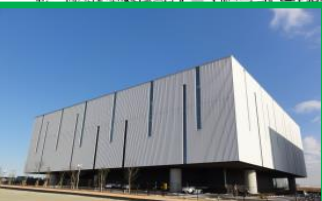
川崎生命科学・環境研究センター(LiSE)(0.7ha) 2013(H25)年3月運営開始

・プロジェクト名称「羽田エアポートガーデン」 事業主体:羽田エアポート都市開発(株)(住友不動産(株)100%子会社) 主要用途:宿泊施設(1,717室)、空港直結の展望天然温泉約2,000㎡、飲食・商業施設(約90店舗)、イベントホール(約2,400㎡・最大700名)、会議室・パンケット、バスターミナル(1日約900便発着する15停留所)