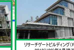
リサーチゲートビルディング(RGB1) 2018(H30)年2月竣工 ●株式会社遺伝子治療研究所 ●セブンイレブン(コンビニ) ●川崎殿町郵便局