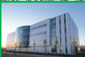
ナノ医療イノベーションセンター(iCONM)(0.8ha) 2015(H27)年4月運営開始