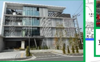
リサーチゲートビルディング(RGB2) 2017(H29)年10月運営開始 ●慶應義塾大学 殿町タウンキャンパス ●東京工業大学 中分子IT創薬研究拠点 ●神奈川県立保健福祉大学 大学院 ●大日本住友製薬(株) ●川崎市キングスカイフロント マネジメントセンター