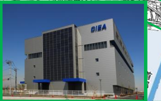
実験動物中央研究所(0.6ha) 2011(H23)年7月運営開始