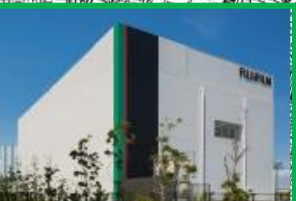
富士フイルム富山化学(株)川崎ラボ(0.3ha) 2017(H29)年6月運営開始