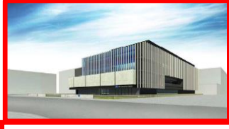
JSR Bioscience and informatics R&D Center(略称:JSR BiRD)【JSR(株)】(0.3ha) 延床面積:約6,440㎡ 2021(R3)年7月開所予定