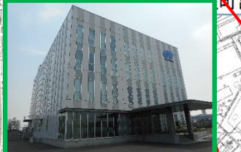
クリエートメディック(株)研究開発センター(0.3ha) 2016(H28)年6月運営開始