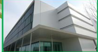
ライフイノベーションセンター(LIC)(0.8ha) 2016(H28)年4月運営開始