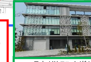
日本メトロニック(株)メトロニックイノベーションセンター 2017(H29)年9月運営開始