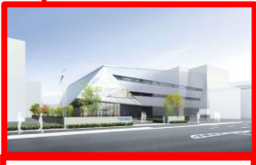
川澄化学工業(株)殿町研究開発拠点(0.4ha) 延床面積:約6,285㎡ 2020(R2)年3月工事着手予定