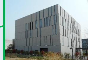
ジョンソン・エンド・ジョンソンインSTITUTE(東京サイエンスセンター)(0.3ha) 2014(H26)年8月運営開始