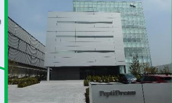
ペプシドリーム(株)(0.5ha) 2017(H29)年8月運営開始