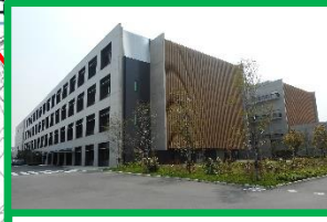
国立医薬品食品衛生研究所(2.7ha) 2018(H30)年3月運営開始