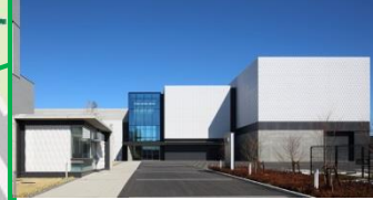
日本アイソトープ協会川崎技術開発センター(1.0ha) 2017(H29)年6月運営開始