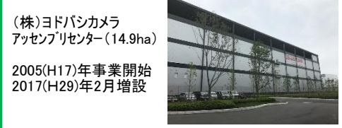
(株)ヨドバシカメラ アップリケーター(14.9ha) 2005(H17)年事業開始 2017(H29)年2月増設